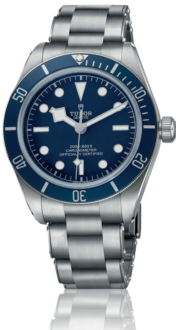
Montre TUDOR Black Bay Fifty Eight Navy Blue Boîtier en acier 39 mm - Etanche jusqu'à 200m Mouvement mécanique à remontage automatique Réserve de marche d'environ 70 heures