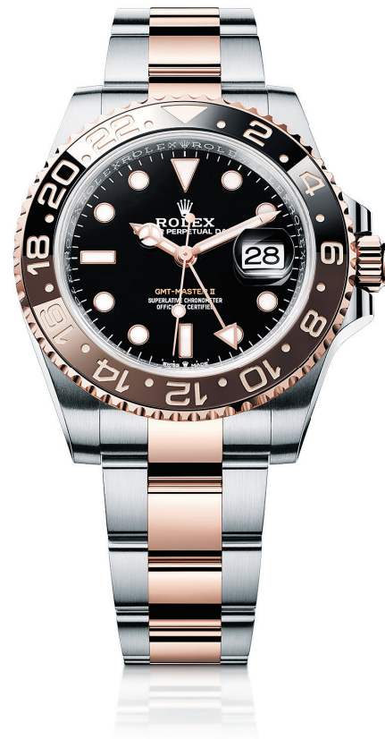
OYSTER PERPETUAL GMT-MASTER II