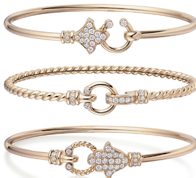
Bracelets Collection Fibula Or rose et diamants - Azuelos