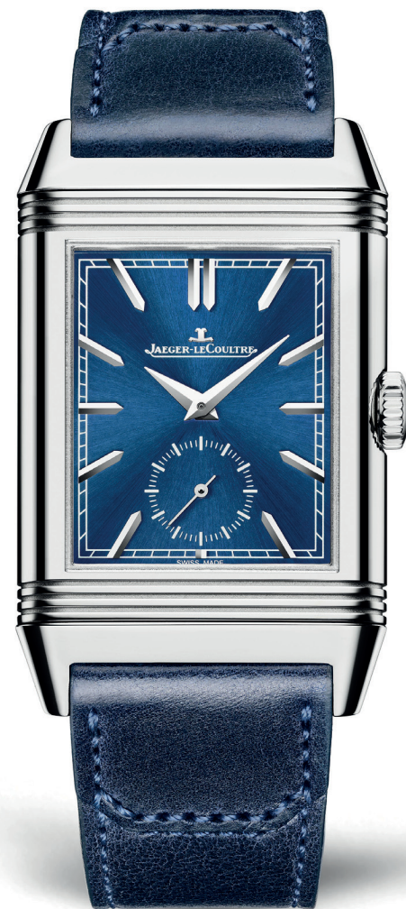
Montre Jaeger-LeCoultre Reverso Tribute Boîtier acier et bracelet cuir Mouvement à remontage manuel