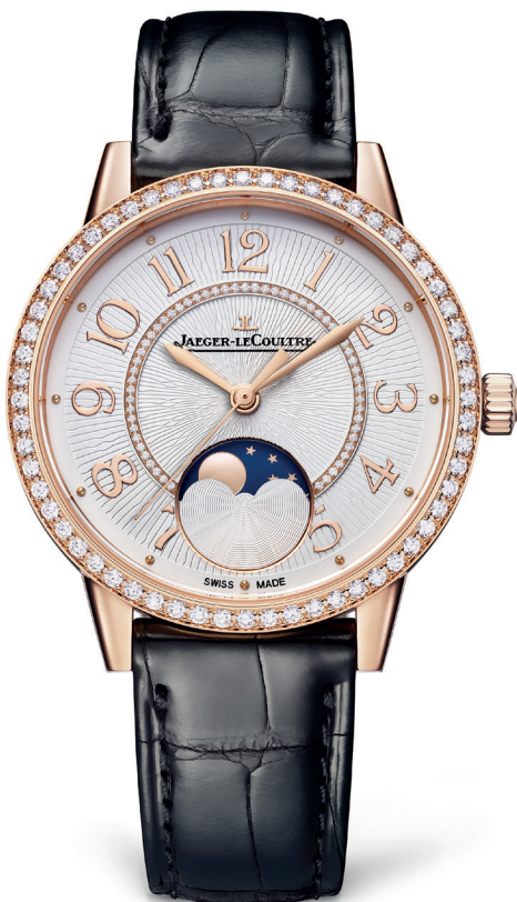
Montre Jaeger-LeCoultre Rendez-vous Moon Boîtier or rose et bracelet alligator Mouvement mécanique à remontage automatique