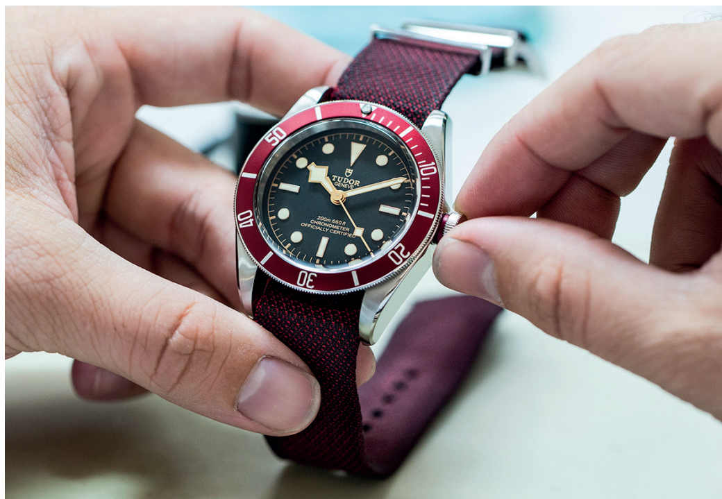
Montre TUDOR Black Bay Boîtier en acier 41 mm - Etanche jusqu'à 200m Mouvement mécanique à remontage automatique Réserve de marche d'environ 70 heures