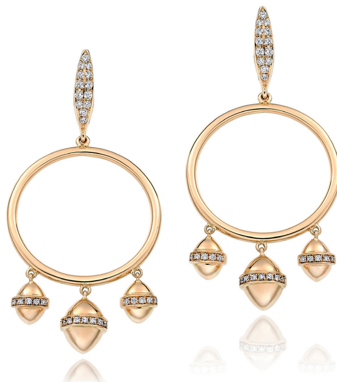
Boucles d'oreilles Collection Tazzarine Or rose et diamants - Azuelos