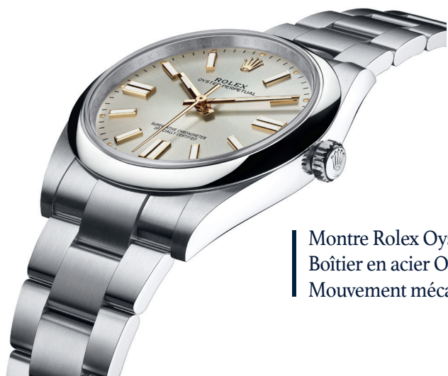
Montre Rolex Oyster Perpetual Boîtier en acier Oystersteel 41 mm Mouvement mécanique à remontage automatique