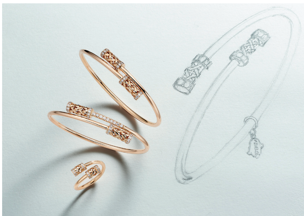
Bracelets et bague Collection Moucharabieh Or rose et diamants - Azuelos