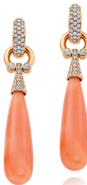
Boucles d'oreilles Collection Fibula Or rose, diamants et corail - Azuelos

En couverture : Manchette "Paon" en or rose et or blanc ajourés, rubellite et pavage diamants - Azuelos.